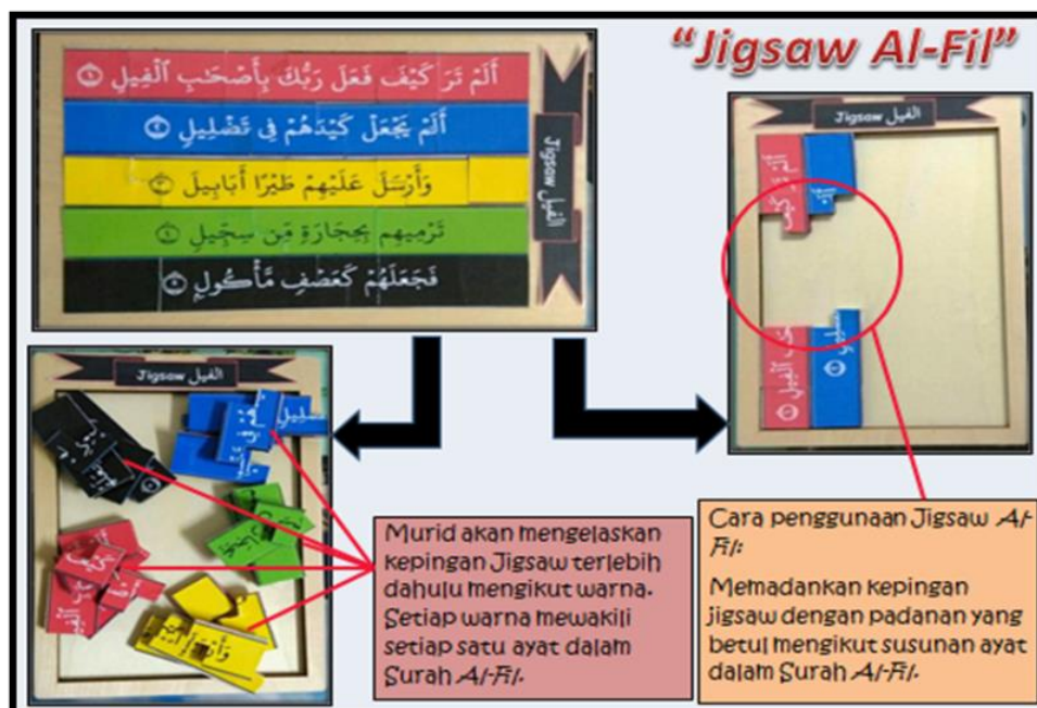
Rajah 1. Jigsaw Al-Fil

Cara penggunaan bahan ini ialah saya telah membahagikan ayat-ayat Surah Al-Fil kepada beberapa warna. Setelah kepingan-kepingan jigsaw tersebut diselerakkan, murid akan mengelaskan terlebih dahulu kepingan-kepingan tersebut mengikut warna. Setelah menyusun mengikut warna, murid akan memadankan jigsaw tersebut membentuk satu ayat demi ayat mengikut warna-warna tertentu. Menurut Ansar (2017), daya seseorang dapat dikembangkan melalui latihan seperti latihan mengamati benda atau gambar, latihan mendengarkan bunyi atau suara, latihan mengingat kata, arti kata, latihan melihat letak suatu kota dalam peta.